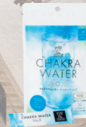
Chakra Water No.5