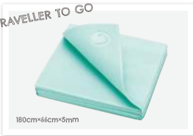
【YW-A112-C099】¥5,000 (税抜) 重さ 750g 素材 TPE(熱可塑性エラストマー)・NR(天然ゴム) 生産国 台湾