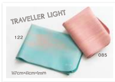
【YW-A116-C(色番号)】¥6,800 (税抜) 重さ 950g 素材 NR(天然ゴム) 生産国 台湾