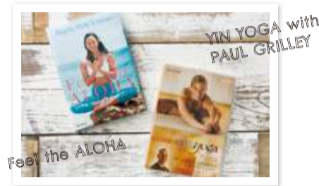
左:【IMWDV-2002】¥2,759 (税抜) 右:【YW44612-02】¥5,800 (税抜)