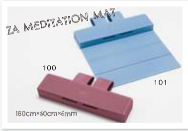
【YW-A113-C(色番号)】¥5,900 (税抜) 重さ 950g 素材 TPE(熱可塑性エラストマー)・NR(天然ゴム) 生産国 台湾