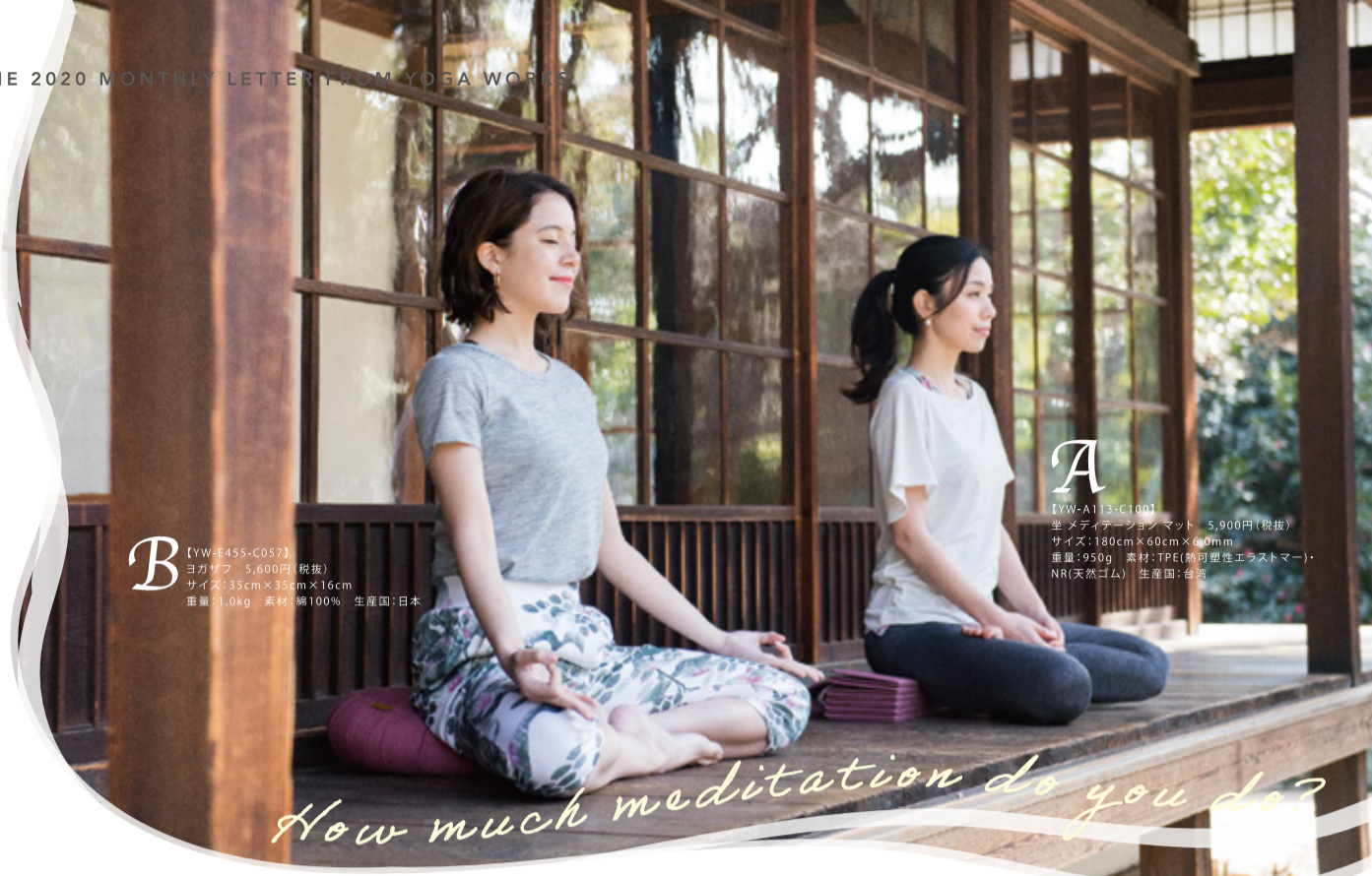
B [YW-E455-C057] ヨガザフ 5,600円(税抜) サイズ:35cm×35cm×16cm 重量:1.0kg 素材:綿100% 生産国:日本

硬すぎず適度に沈み、臀部をふんわり包み込む感触が心地いい。メディテーションのために調整されたヨガ用の座布は、長時間正しい姿勢をサポートしてくれます。有機の落ち綿をリサイクルし、国内の熟練の職人によって手作りされている一品。ころんとしたフォルムはお部屋のインテリアにも◎