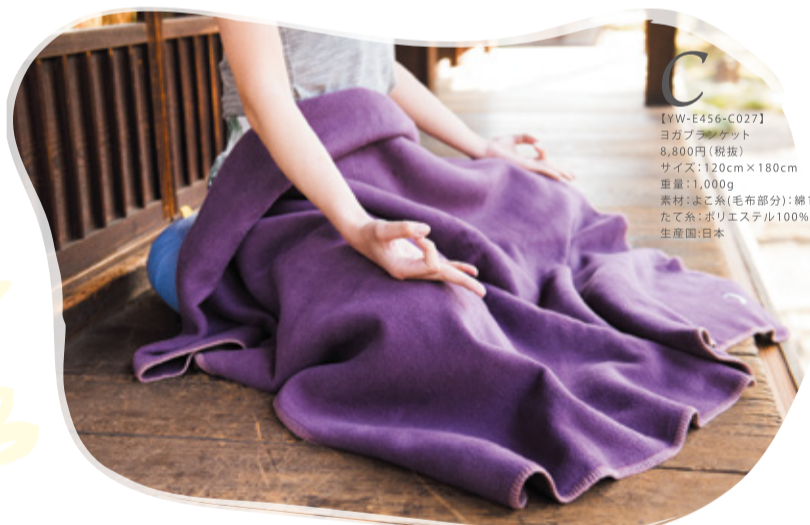
C [YW-E456-C027] ヨガブランケット 8,800円(税抜) サイズ:120cm×180cm 重量:1,000g 素材:よこ糸(毛布部分):綿100% たて糸:ポリエステル100% 生産国:日本