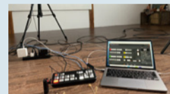
blackmagic design ATEM Mini Pro