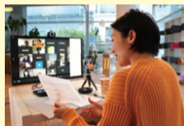
PCとスマホの2台使いをしている講師も

Veda Tokyoではドロップインのほか、毎月100本以上のライブ配信プログラムが受け放題になる月額3,000円の「シルバー会員」、さらにワークショップも受け放題になる「ゴールド会員」など合計3つのプランを用意しています。毎月、生徒さんの関心が高いテーマのワークショップを多数企画しているため、シルバー会員から始めて途中でゴールド会員以上に変更される方も大勢いらっしゃいます。また会員様は基本的に予約不要なほか、録画配信も行なうなど、使いやすく続けやすい工夫を常に考えています。