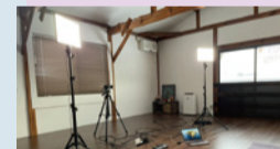
sony ZV-1 sony ECM-AW4/ RODE HS2