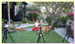
RODE ロード Wireless GO ESDDI ビデオライト

ヨガ、瞑想インストラクター。医師、マッサージセラピストとしての経験を通して、身体への深い興味と理解を持つ。主にオンラインでヨガや瞑想が人々のより身近なものになり、多くの人が幸せに自分らしく生きていく手段をシェアしている。