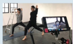
正面、手元の資料、アーサナの3つのカメラをライブでスイッチングする機材も使用

Quiet timeディレクター、鍼灸師、元立教女子短期大学非常勤講師。サンフランシスコでヨガと出会う。医療系の専門学校で解剖学、生理学、東洋医療、鍼灸学を学びヴィンヤサスタイルのティーチングには定評がある。アパレルデザインやヨガ用の楽曲制作も行う。