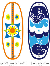
サンダンス・ムーンシャイン 070 オーシャンブルー 059

ヨガワークスでは空気を注入して使用するインフレータータイプのプール専用SUP YOGAボードを販売中です。ロング、ワイドサイズで安定感とクッション性があり、重心をとりやすいのが特徴。使用しない時は空気を抜いてコンパクトに収納可能です。