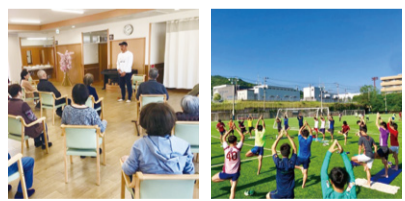
老人ホームでお年寄りに向けてヨガ 所属するサッカー部でヨガ