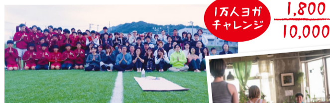
「台風19号災害支援募金チャリティーヨガイベント」を母校福岡大学で開催。募金額約27万円を吉日本新聞社を通じて赤十字社に寄付。たくさんの人を笑顔にしたいという思いが伝わってきますね。