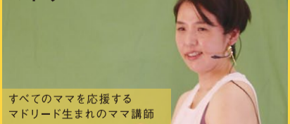
すべてのママを応援するマドリード生みのママ講師