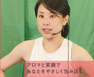
アロマと笑顔であなたをやさしく包み込む