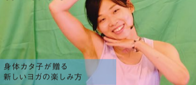
身体カタ子が贈る新しいヨガの楽しみ方