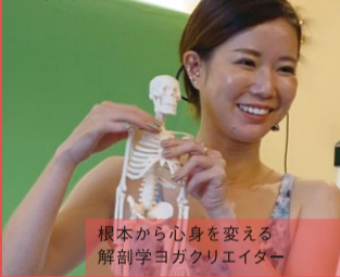
根本から心身を変える解剖学ヨガクリエイター