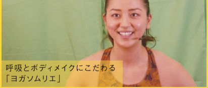
呼吸とボディメイクにこだわる「ヨガソムリエ」