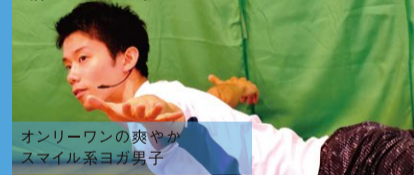
オンリーワンの爽やかなスマイル系ヨガ男子