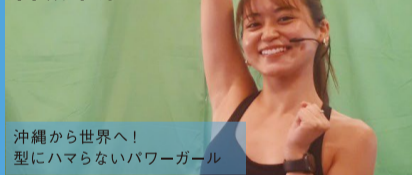
沖縄から世界へ！型にハマらないパワーガール