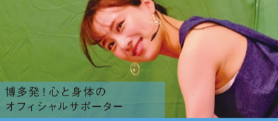
博多発！心と身体のおフィシャルサポーター