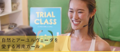
自然とアーユルヴェーダを愛する湘南ガール