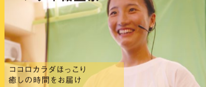
ココロカラダほっこり癒しの時間をお届け