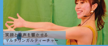
笑顔と歌声を響かせるマルチリンガルティーチャー