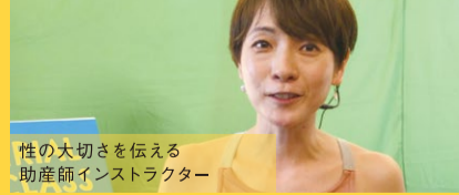
性の大切さを伝える助産師インストラクター