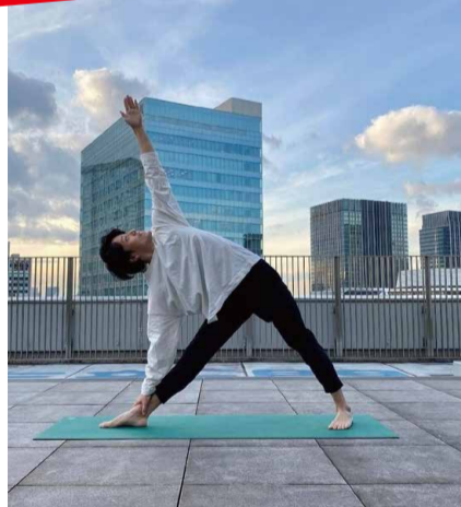
無印良品ではインスタライブも行っています。屋上で撮影しています！

無印良品の社員として勤務しながら、休日は社内副業で業務委託としてヨガを教えています。社外副業で所属しているfollow Pilates Yoga Studioは、レッスン指導の他にもイントラ向け研修が充実しており、多くの学びの機会をいただける素敵なスタジオです。そこでの学びをベースに、無印良品やハスヨガ銀座でも生徒さんが気持ちよくヨガを行っていただけるように指導にあっています。ひとつでも良いから身体に無理のないポーズの取り方を学んで持ち帰っていただきたいという思いを込めて、説明の時間を大切にしています。